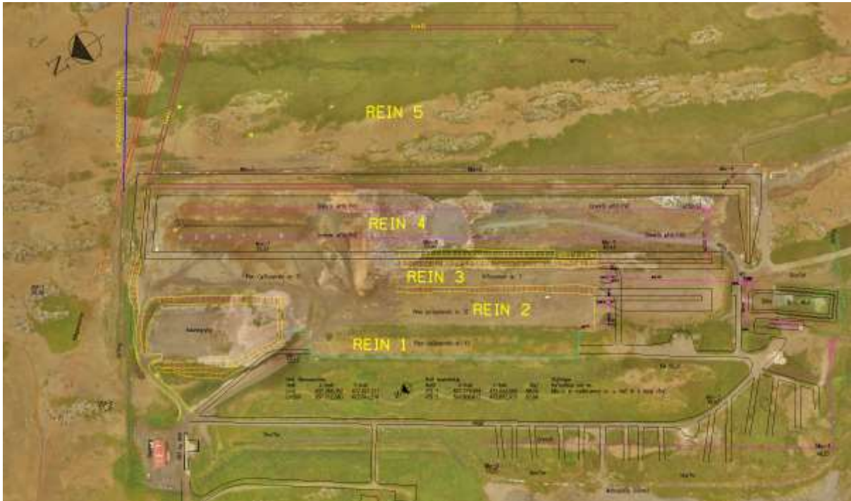
Mynd 1. Reinar sem gerðar hafa verið í Fíflholtum frá upphafi og fyrirhuguð rein 5.

Eftirfarandi mynd gefur gróft yfirlit yfir núverandi urðunarsvæði og fyrirhugaða viðbót, en myndir 3-5 fela í sér nánari upplýsingar.