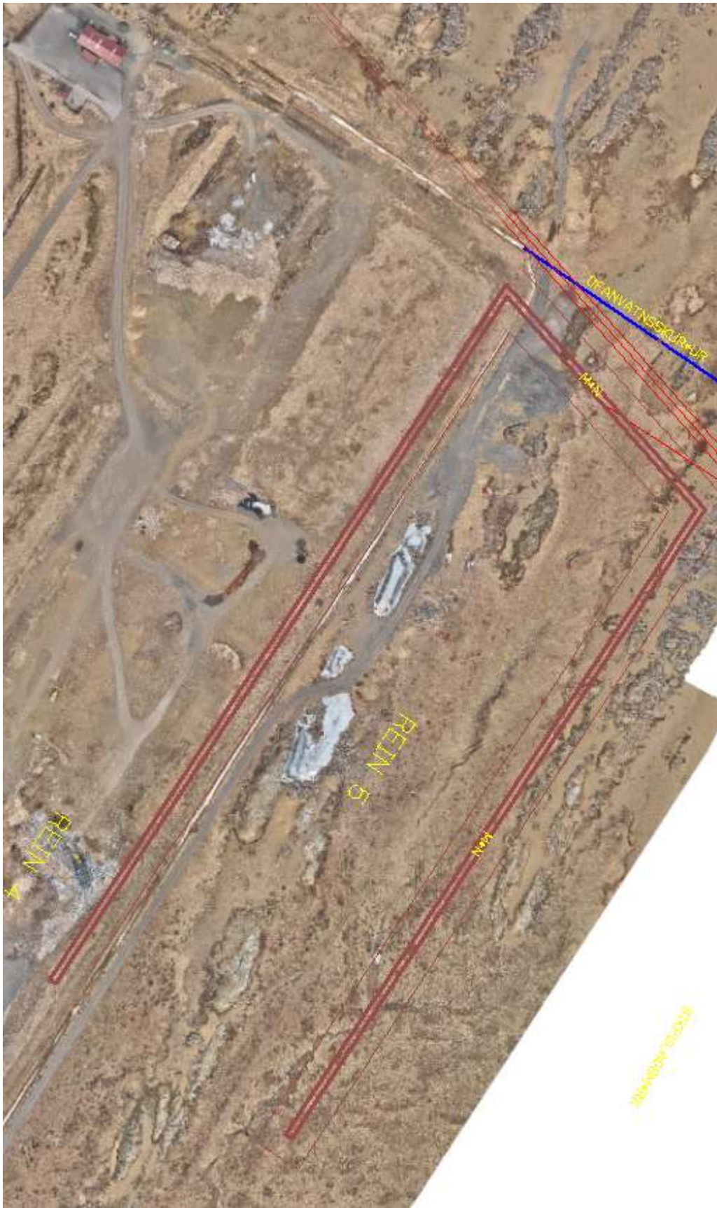
Mynd 5. Rein 4 sem áætlað er að fyllist innan tveggja ára og rein 5 sem kæmi við hlið hennar.